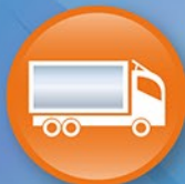
Транспортные и сельскохозяйственные предприятия